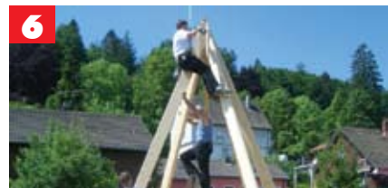
Wenn wir erklimmen...