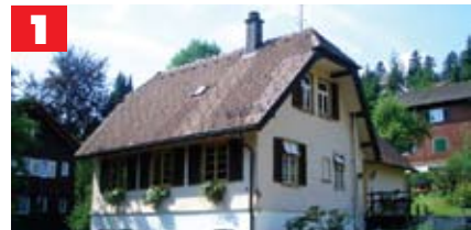
Das Haus vor dem Umbau

Lernen Sie dieses Haus kennen und erleben Sie, dass Wohlfühlen und ökologisches Bauen zusammengehören.