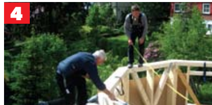
Alle Maße stimmen!