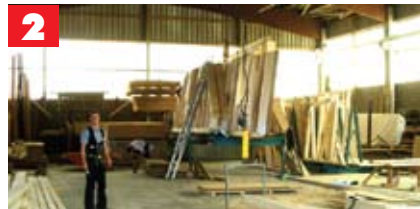
Vorfertigung in der Halle verkürzt die Bauzeit