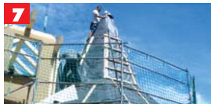
...steigen dem Gipfel zu.