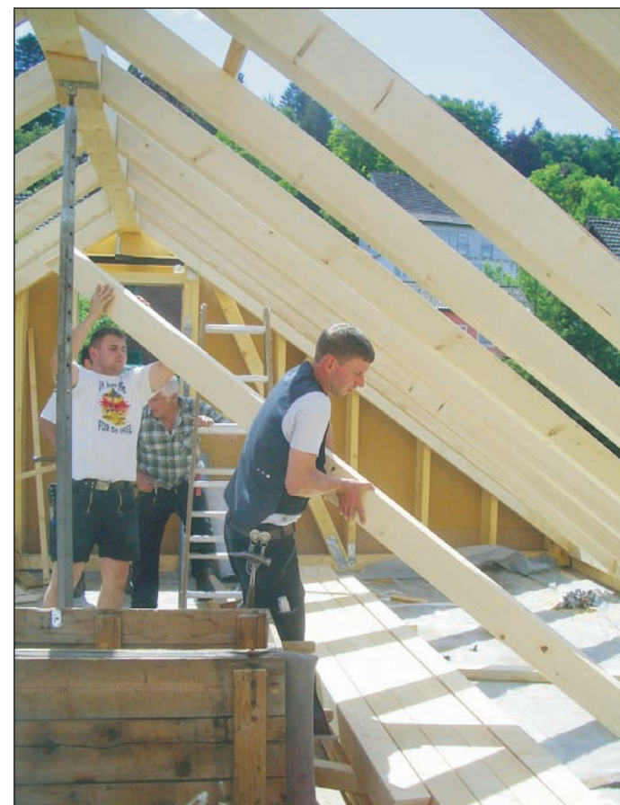
Die Zimmerleute stellen den neuen Dachstuhl fertig.